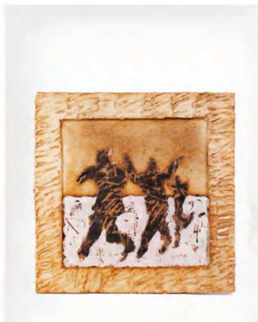
Job Heykamp, links Doos , 2012, steengoed, 30 x 35 x 12 cm | midden Vaasvorm , 2012, steengoed, h 6 cm, Ø 11 cm | rechts Paneel , 2012, steengoed, 35 x 35 cm