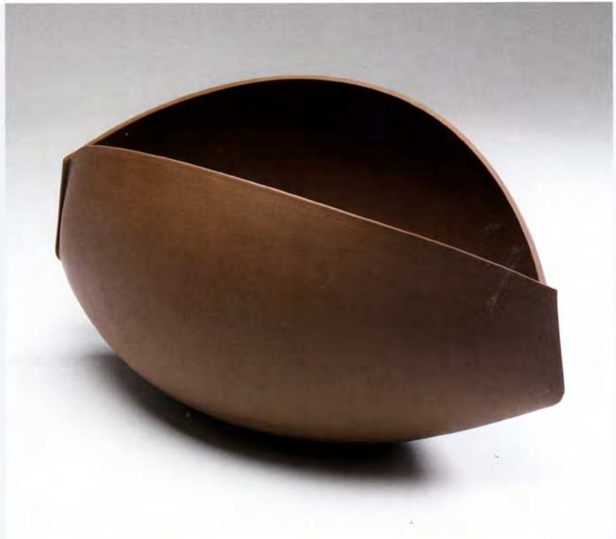
Ann Van Hoey, Object , 2012, steengoed; 21 (h) x 41 x 24 cm.

Ann Van Hoey. Galerie Terra Delft, Nieuwstraat 7, NL-2611 HK Delft, t +31 (0)15-2147072. Open: dinsdag t/m vrijdag 11.00-18.00 uur, zaterdag 11.00-17.00 uur. Van 16 februari t/m 16 maart 2013. www.terra-delft.nl