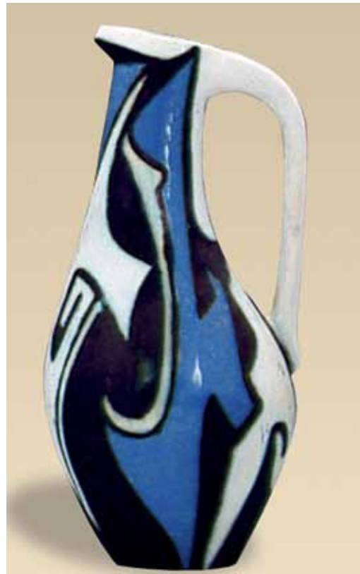
rechts Goedewaagen, schenkan, ontwerp Zweitse Landsheer, decor Inca van Willem van Norden, ca. 1957.