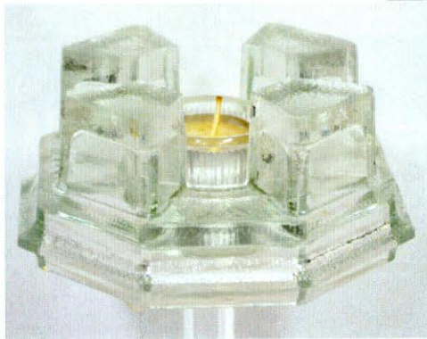
Twee gloeilamp-vormige flessen, 1960. Rechaud met waxineglaasje

Toen in 1967 tot verbijstering van het eigen personeel en de bevolking van Nieuw Buinen door de directie van de Verenigde Glasfabrieken de vestiging van 'Voorheen Meursing' gesloten werd, bleef Nanninga als enige fabrikant over. In de sowieso al ondermaatse, landelijke geschiedschrijving over de bijzondere glasproductie in Nieuw Buinen wordt zijn fabriek vrijwel niet genoemd. En vergeten is ook dat Nanninga uit