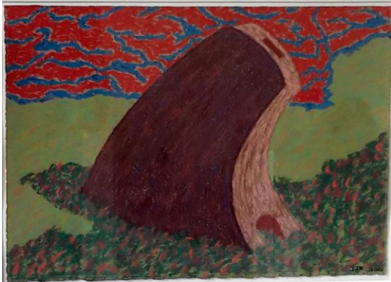
Jan de Rooden, Pastel 'Chute d'un pot', 2003