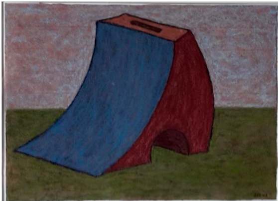
Jan de Rooden, Pastel 'Monument pour un pot', 2003'