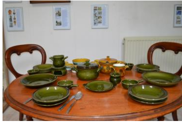
Goedewaagen, eetservies Landhuis, ovenvast, 1964-1982