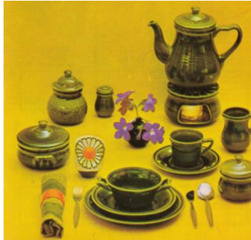
Goedewaagen, folder, décor Landhuis, ca 1964