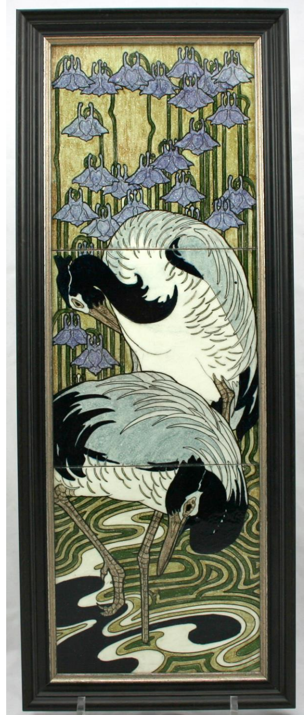
Lotus, tegelstrip, japonaïserie met kraanvogels; coll. Meentwïjck (zie zaal 2, vitrine F Distel-Lotus)