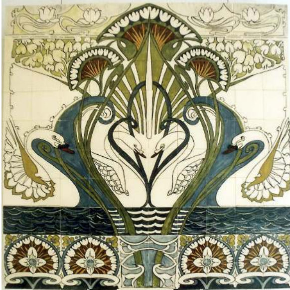
Royal Goedewaagen, tegeltableau, 1992, schilder Gerard van Doorn,; coll. Ellen Westenberg