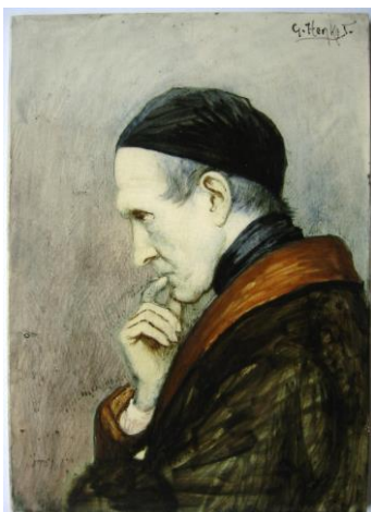
1. Rozenburg, tegelschildering Gerke Henkes, voor 1895