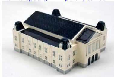
Goedewaagen, Concertgebouw, M3011

Foto's 2, 3, 4, 6, 11 – coll. Meentwijk Foto 8-9 – coll. Nederl. Tegelmuseum Foto 1-5-6-11 – coll. Kermatisch Museum Goedewaagen