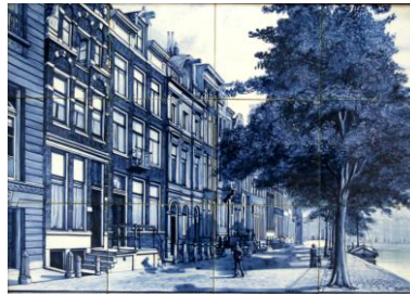
De Distel, Begin Herengracht, 1915