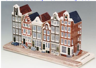
Goedewaagen, Herengracht 659-669