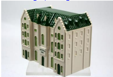
Goedewaagen, Hooiberg-1867, voor NV Heineken, Stadhouderskade