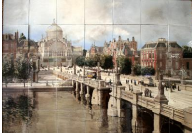
De Distel, Paleis van Volksvlijt, 1915