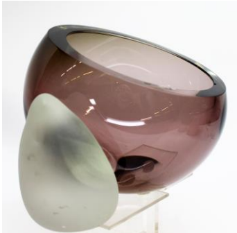
2. In entreegang - Glaswerk uit de Drents-Groninger Veenkoloniën, 140 topstukken uit collectie Henk Brans