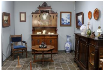
5. Huizinga Kabinet, stijlkamer met Nederlandse kunstnijverheid 1900-1940; meubels van Groninger meubelfabriek Huizinga