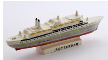
10. Gang met miniaturen en HAL-edities; voorin vitrines met middeleeuwse beerput vondsten en majolica 1550-1650, Tichelaar.