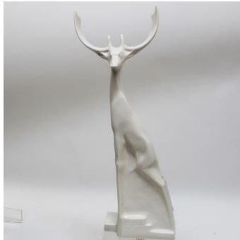
7. Zaal 2. Expo Nederlandse keramiekplastieken en fabrieken van PZH, Distel, Goedewaagen Holland-Utrecht, Arnheemsche. Middenin pioniers Nederlandse kunstglazuren: Mauser, Lanooij, Verlee en Nienhuis