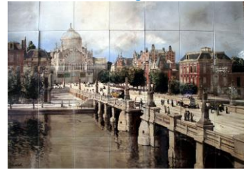
9. Ontvangsthal – Rozenburg-tegels en tableaus v.a. 1885; Distel, Goedewaagen, PBD. Vitrines PZH-matvogel; Goudse pijpen en tableaus diverse fabrieken – in voorruimte toiletten

Wanden: in 1990 geconserveerd 7-delig Distel-tegeltafelau Herestraat 101, Groningen, 1903