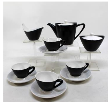
Regina, servies Black Princess

Permanente films: - Zaal 1 Gouda Pottery Book en Goedewaagen-plateel, april 2007. Zaal 2 Productie Heineken-miniatur. Ontvangsthal – beeldbank met o.a. Goedewaagen-serviezen en doorlopend TV-programma. Glaszaal – Bert Haanstra, Glas, 1958, Leerdam.