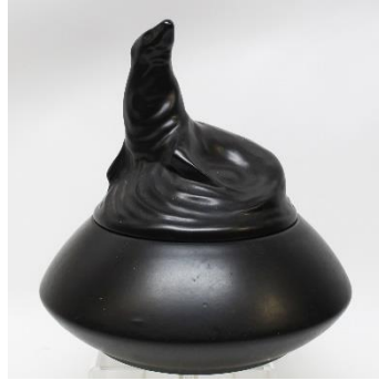
PZH, Gouda – Jan Schonk, 1928, zeehond op schaal