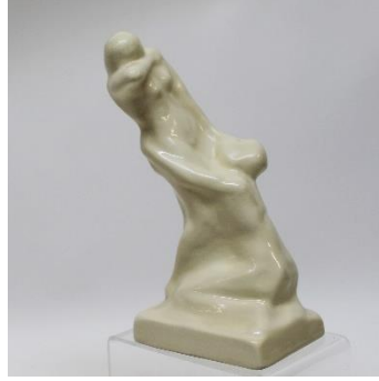
Schoonhoven – Cris Agterberg, jaren 30, rouwende vrouwen