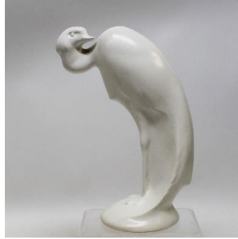
PZH, Gouda – Theo Vos, ca 1930, struisvogel