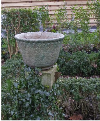
Bert Nienhuis, cachepot, 1938