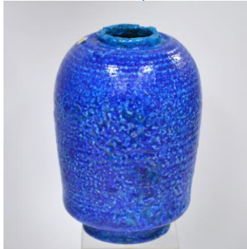
Bert Nienhuis, expressief gedeco- reerde vaas in blauw, 1938