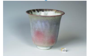
Bert Nienhuis, vaas, matterend paars naar koperrood, 1954