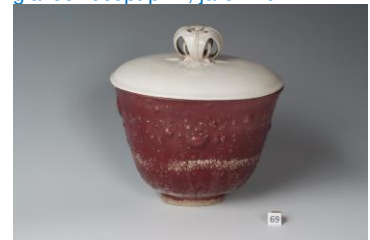
Bert Nienhuis, dekselpot, 1949, os- senbloedrood met glanswit deksel