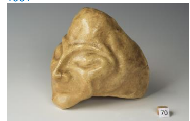
Séline d'Andrade, maskerplastiek, 1921, Quellinus