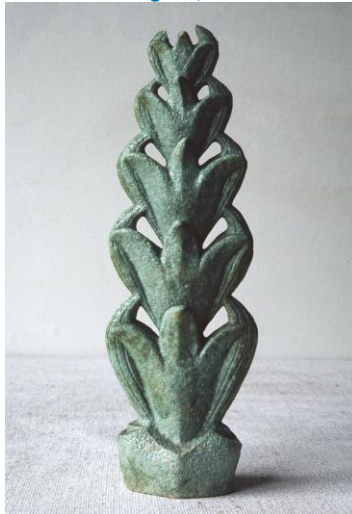
Bert Nienhuis, floraal object, h. 32,5 cm, jaren 30