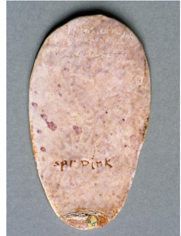
Bert Nienhuis, keramisch blad met glazuurrecept pink, jaren 40