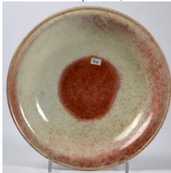
Bert Nienhuis, schaal met ossen- bloed koperexperiment, 1950