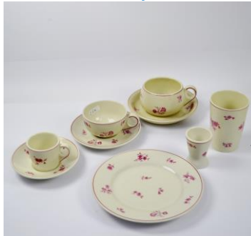
MOSA, Sphinx en Hutschenreuther, porceleinen serviesgoed tot in jaren 50, afgemerkt NASM