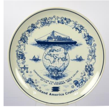
Goedewaagen, Worldcruise ss Veendam III 1974, in plaats van ss Rotterdam V