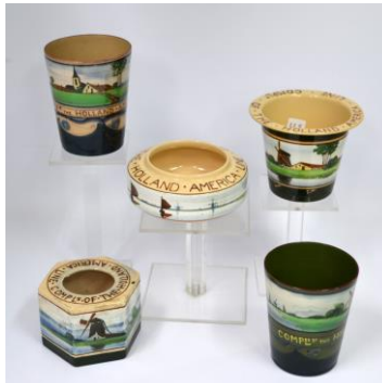
PZH, Gouda, reiziger cadeaus, 1906-1910