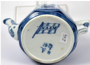
MOSA, Langelij's-theepot voor NASM met pseudo Chinees merk