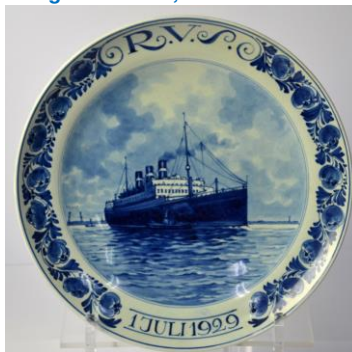
Porceleyne Fles, Statendam, 1929, uitgave verzekeraar R.V.S; verzekerde som Hfl. 300 miljoen.