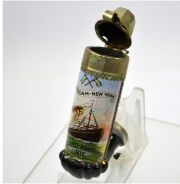
Onbekend (Duits fabricaat), pijp met transferdecor, jaren 20

Het Veenkoloniaal Museum in Veendam waarmee wij ook voor andere erfgoedprojecten nauw samenwerken, brengt tot 7 oktober 2018 onder de titel 'Veendam in de vaart' een breed opgezette expositie over de vier HAL-schepen onder de naam Veendam en hun voorganger, het ss W.A. Scholten, vernoemd naar de stichter van het Veendammer aardappelmeelconcern.