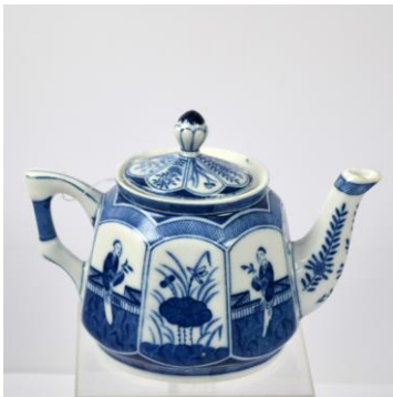
MOSA, Langelij's-theepot voor NASM met pseudo Chinees merk, voor 1900