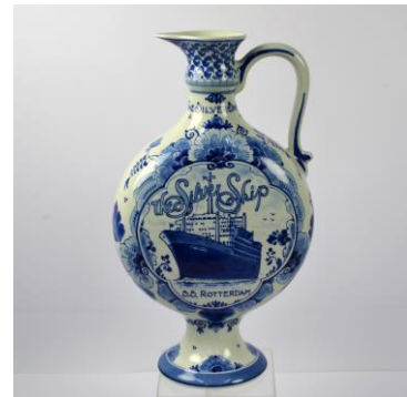
Porceleyne Fles, niet uitgebracht cadeau, Rotterdam V, 1983 Zenith, asbak met HAL-logo, eind jaren 50