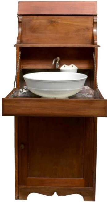
NASM, wasmeubel, ss Rotterdam II, ca 1878, waskom Engels fabricaat