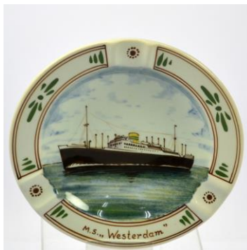
Crabeth, Gouda, asbak, Westerdam, jaren 50