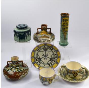
Holland-Utrecht, reiziger cadeaus voor 1906