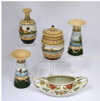
Potterij Rembrandt, Nijmegen, reiziger cadeaus, 1911-1915