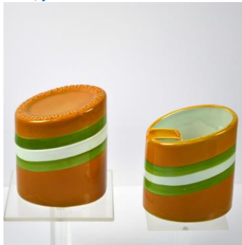
PZH, doosje en asbak in vorm scheepspijpen, na 1957