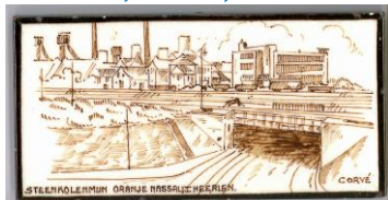
Heerlen, Oranje Nassau Mijl, J. Corvé