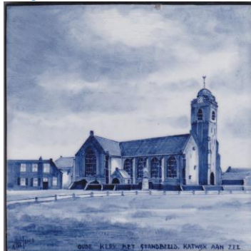
Katwijk, Oude Kerk, H. C. de Jong