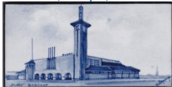
Boskoop, Flora, Guérain jr