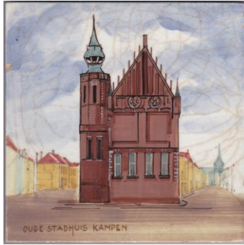
Kampen, stadhuis, J. van Dam