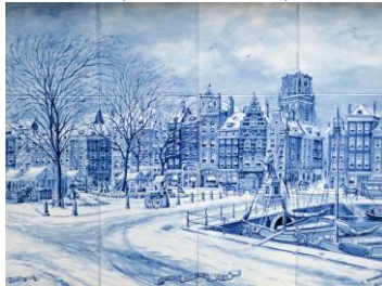
Rotterdam, tegeltableau, oude binnenstad in 1887, A. Stolk