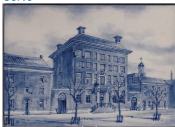
Rotterdam, Entrepot, A. Stolk