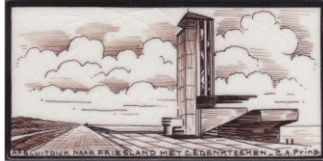
Afsluitdijk, Monument, C. Prins