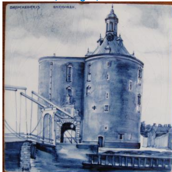
Enkhuizen, Drommedaris, A. Stolk