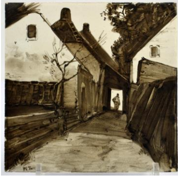
Willem de Zwart