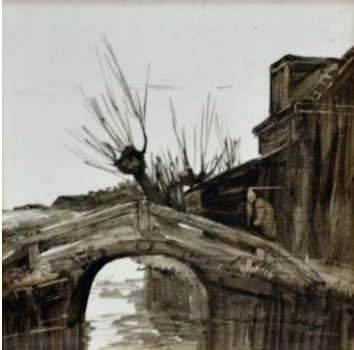
Willem de Zwart