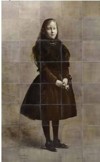
Daniël Harkink, prinses Wilhelmina in rouwdracht, 1891