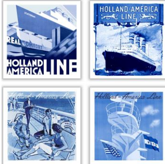
Goedewaagen Mariner-tegels, 10 x 10 cm, ontwerp Sander Alblas