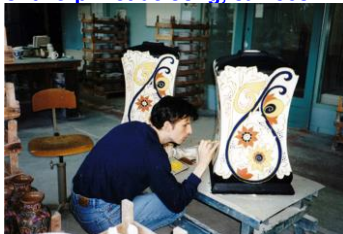
Goedewaagen, unica beschilderd door Sander Alblas voor MS Veendam, 1999