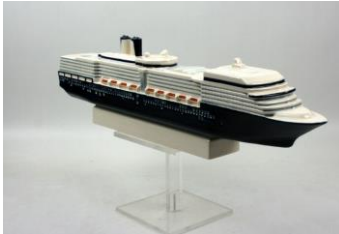
Goedewaagen, miniatuur MS Nieuw Amsterdam, 2015, l. 42 cm, ontwerp Sander Alblas