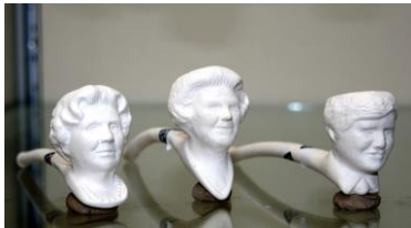
April 2013, 3 koninklijke portretten, ontwerp Roy Greve