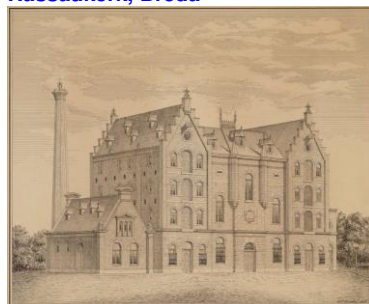
Jun-Nov. 2014, 86.000 miniaturen van De Hooiberg voor NV Heineken