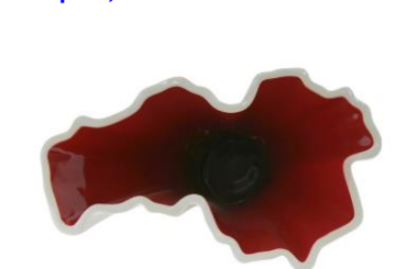
Mei 2013, Noord-Brabant vaas, ontwerp Sander Alblas