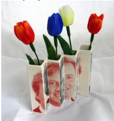
April 2013, Four tulips vase, ontwerp Paul Baars