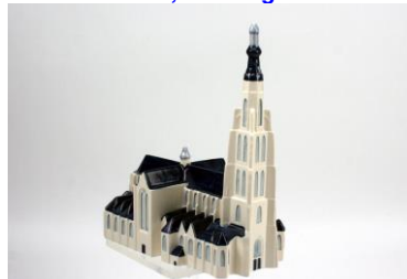
Apr. 2014, miniatuur Grote of Nassaukerk, Breda