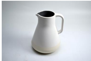
Okt. 2013, Melkkan voor Friesland Campina, ontw. Robert Bronwaaser