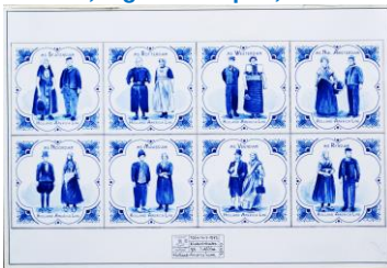
Mariner, tegelontwerpen, 1999