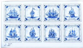
Mariner, tegelontwerpen, 1998