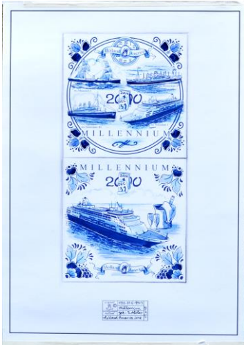
Millennium-viering, tegelontwerpen, 1999; 15 x 15 cm