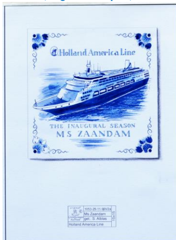
Inaugurale vaart MS Zaandam, tegelontwerp, 19998