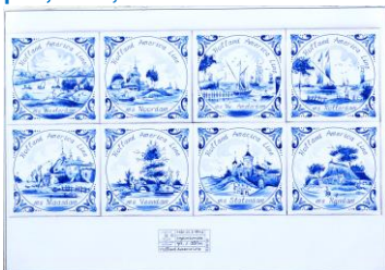
Mariner, tegelontwerpen, 1999