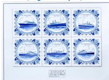
Mariner, tegelontwerpen, 2001