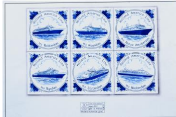
Mariner, tegelontwerpen, 2000