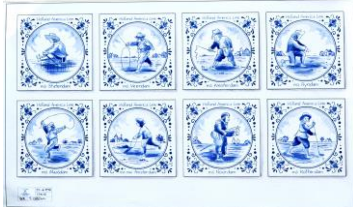
Mariner, tegelontwerpen, 1998