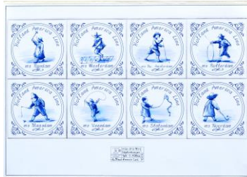
Mariner, tegelontwerpen, 1999