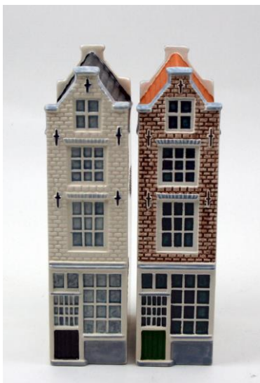
Oude Hoogstraat 22, Asd, kleinste huisje, 1737, miniatures 2014