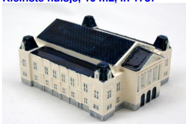
Concertgebouw, miniatuur, 2012