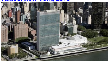
UN-gebouw, New York, architect Oscar Niemeyer, 1951