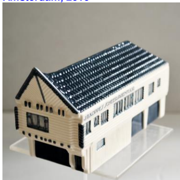
Goedewaagen, NACO-kantoor, IJ, Amsterdam, 2016, voor Stadsherstel