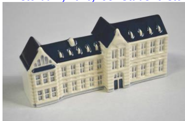
Goedewaagen, Drostehuis Assen, oud-Provinciehuis Drenthe, 2016