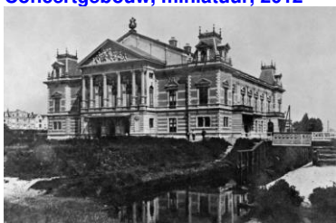
Architect Dolf van Gendt, april 1888