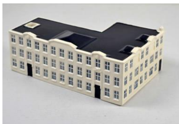
Goedewaagen, Looiersdwarstraat, Amsterdam, 2016