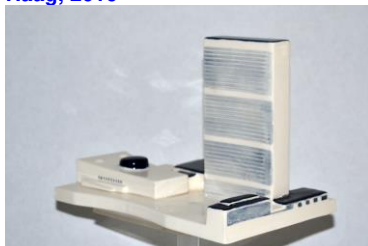
Goedewaagen, Gebouw Verenigde Naties, New York, 2016