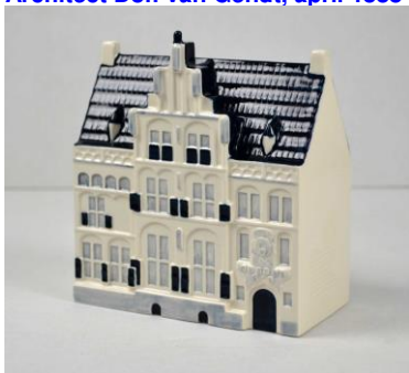
Goedewaagen, Gemeenlandshuis Delfland-Waterschap, Delft, 2017