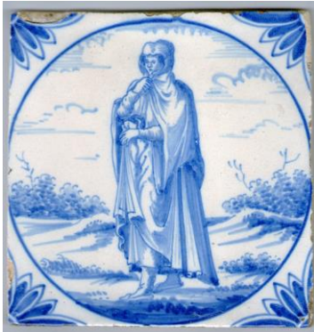
Gebr. Ravesteijn, hardtegel voor Engeland.