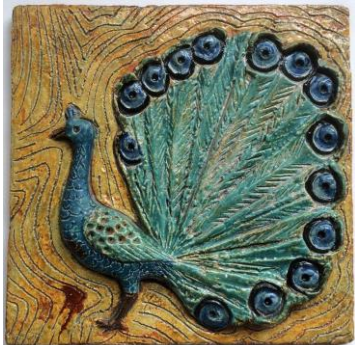
Westraven, hoogrelief, 'Pauw'.