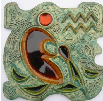
Westraven, hoogrelief, Luigi Amati, 'Waterman'.