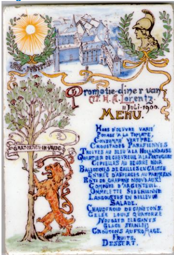
Gebr. Ravesteijn, Menutegel voor promotie Lorentz, 1900.