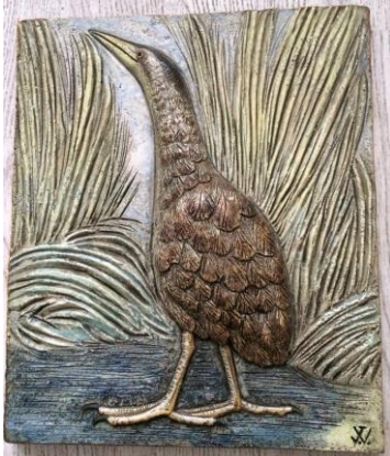
Westraven, hoogrelief, 'Roerdomp'