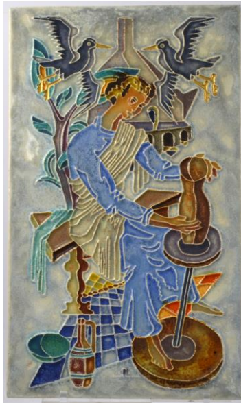
Westraven, cloisonnétegel, 'De pottenbakker', Lovades, 1948