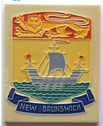
Westraven, cloisonnétegel New Brunswick, Canada.