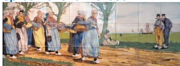
Westraven, tegeltableau, ca 1920, streekdracht Veluwe, Arie Kortenhoff, 1920.