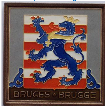
Westraven, cloisonnétegel Brugge.