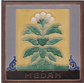
Westraven, cloisonnétegel Medan.