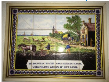
Westraven, tegeltableau met spreuk over akkerbouw.