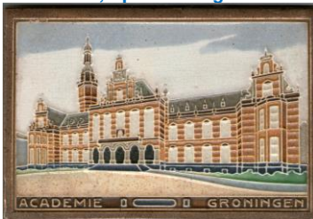
Westraven, Cloisonnétegel Academiegebouw RUG Groningen.