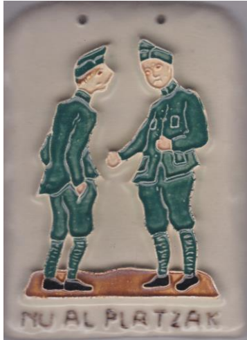
Westraven, Mobilisatietegel 1939.