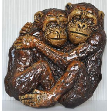
Westraven, hoogrelief, 'Chimpansees'.