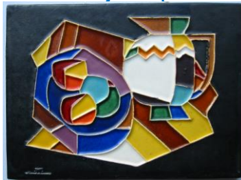
Westraven, cloisonnétegel, 'Stilleven', onder 'Gitaarspeler'