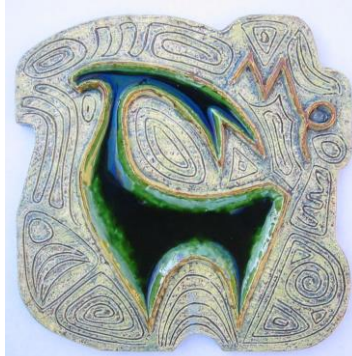
Westraven, hoogrelief, Luigi Amati, 'Steenbok'.