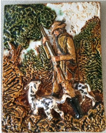
Westraven, hoogrelief, 'Jager'.