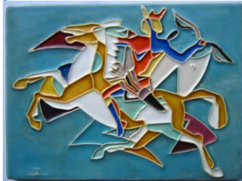
Westraven, cloisonnétegel, Lovades 'Strijder te paard'.