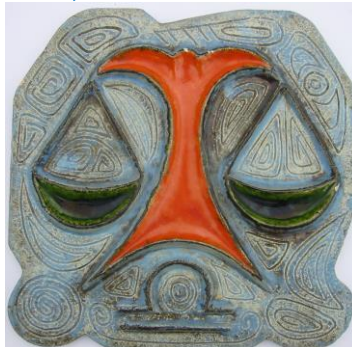
Westraven, hoogrelief, Luigi Amati, 'Weegschaal'.

Haags Gemeentemuseum binnenkort een solo-tentoon-