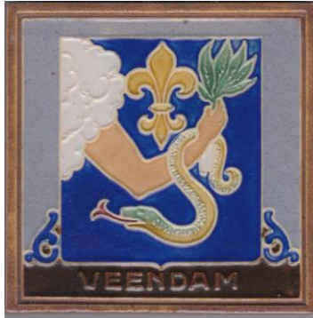
Westraven, cloisonnétegel gemeente Veendam.