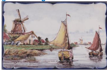
Westraven, plateeltegel met Hollands waterlandschap.