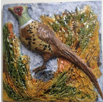
Westraven, hoogrelief, 'Fazant'