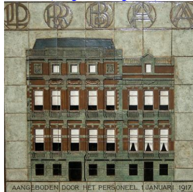
Porceleyne Fles, Bank Boissevain, Herengracht 237-239, 1917