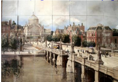
De Distel, Paleis van Volksvlijt, 1915