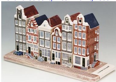
Goedewaagen, Herengracht 659-669