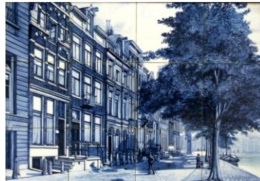
De Distel, Begin Herengracht, 1915