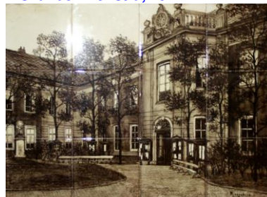
Rozenburg, binnenplaats G.U. Oudemanhuispoort, A. Wijnhoff, ca 1894