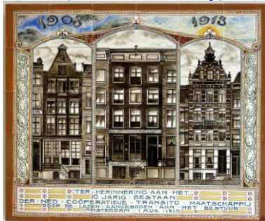
PBD, Transito-maatschappij, 1913