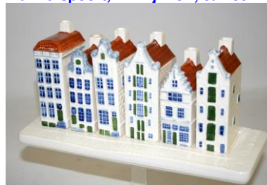
Goedewaagen, straatje Prinsengracht, editie 2013

Foto's 2, 3, 4, 6, 11 – coll. Meentwijk Foto 8-9 – coll. Nederl. Tegelmuseum Foto 1-5-6-11 – coll. Kermaisch Museum Goedewaagen