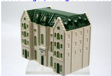
Goedewaagen, Hooiberg-1867, voor NV Heineken, Stadhouderskade