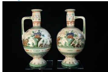
PZH, Gouda, dec. Antiek, onderglazuur, juli 1918