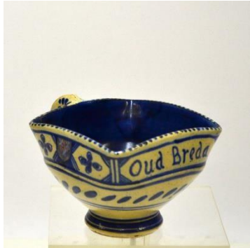
PZH, Gouda, dec. Oud Breda, onderglazuur, ca 1910