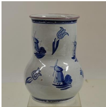
Goedewaagen, Gouda, dec. Moulin, tinglazuur, W.H van Norden, 1939