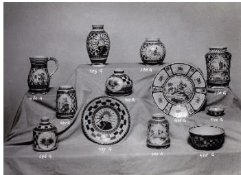
Goedewaagen, Gouda, dec. Marnix, tinglazuur, W.H van Norden, reclamefoto, 1939