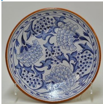
Goedewaagen, Gouda, dec. Knautia, tinglazuur, W.H van Norden, 1939