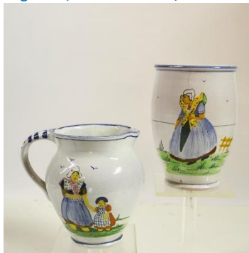
Goedewaagen, Gouda, dec. folklore, tinglazuur, W.H van Norden, 1939

In het verlengde van de schenking door Pieter Baas van oud-Nederlandse majolica van 1550 tot 1650 brengt het museum voor de productie van de Plaatelbakkerij Zuid-Holland en vooral die van Goedewaagen