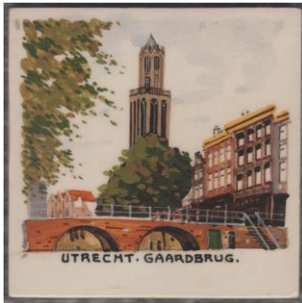
Ivora, Utrecht, Gaardbrug, Domtoren, 10 x 10 cm