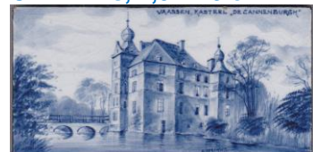
Zenith, Vaassen, Kasteel De Cannenburgh, A. Verschut, 7,5 x 15 cm