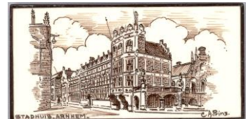
Zenith, Arnhem, Stadhuis, C.A. Prins, 7,5 x 15 cm