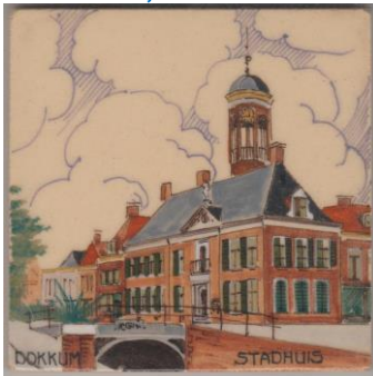
Goedewaagen, Dokkum, Stadhuis, W. van Norden, 10 x 10 cm