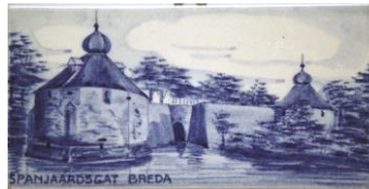
Goedewaagen, Breda, Spanjaardsgat, J. Guérain, 7,5 x 15 cm