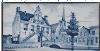
Zenith, Oud-Beijerland, Raadhuis, A. Stolk