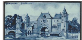
Zenith, Amersfoort, Koppelpoort, C. Verwoerd