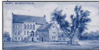
Zenith, Uden, Gemeentehuis, A. Verschut