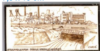
Zenith, Heerlen, Steenkolenmijn Oranje-Nassau, Corvé, 7,5 x 15 cm

1929 kregen die fabrieken het heel moeilijk.