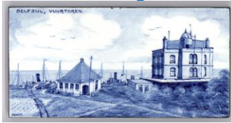
Zenith, Delfzijl, Vuurtoren, A. Verschut, 7,5 x 15 cm