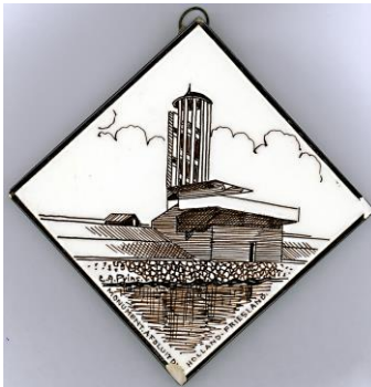
Zenith, Afsluitdijk, Vlieter Monument, Dudok 1933, C.A. Prins, 10 x 10 cm