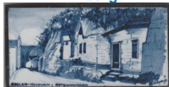
Zenith, Geulem-Houthem, Rotswohnungen, J. Guérain, 7,5 x 15 cm