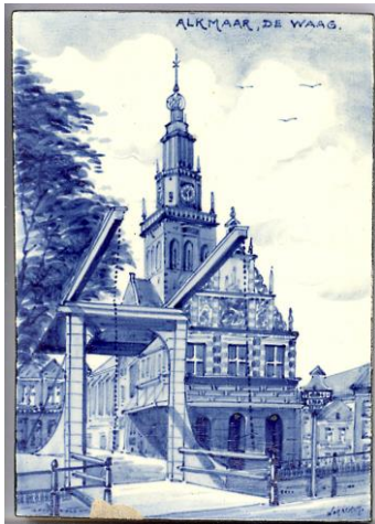
Zenith, Alkmaar, De Waag, A. Verschut, 14 x 10 cm