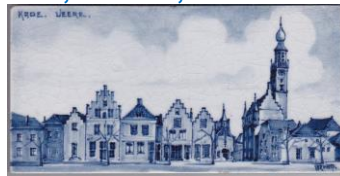
Zenith, Veere, Kade, C. Verwoerd, 7,5 x 15 cm