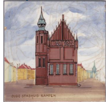
Zenith, Kampen, Oude Stadhuis, Van Dam, 15x15