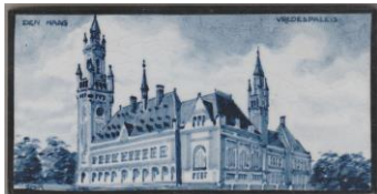
Zenith, Den Haag, Vredespaleis, A. Stolk, 7,5 x 15 cm