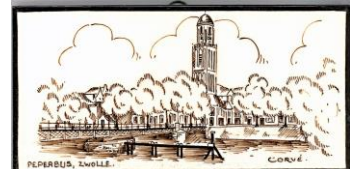
Zenith, Zwolle, Peperbus, Corvé, 7,5 x 15 cm