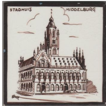
Zenith, Middelburg, Stadhuis, A. Stolk, 10x10