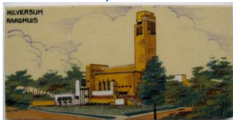
Goedewaagen, Hilversum, Raadhuis, Dudok, 1931, W. van Norden, 7,5 x 15 cm