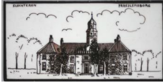
Zenith, Slochteren, Fraeylemaborg, 7,5 x 15 cm