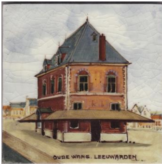
Iris, Leeuwarden, Oude Waag, 10 x 10 cm