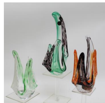
Emil Pfeiffer, polychrome kristalobjecten, jaren 90

Aanmelding voor de opening op 6 november om 14.00 uur via mail@keramischmuseumgoede-waagen.nl