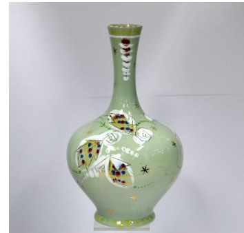
Decor Hermelijn, groen, ca 1950