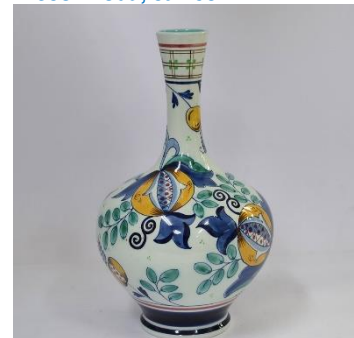
Decor Modern Dutch, 1954