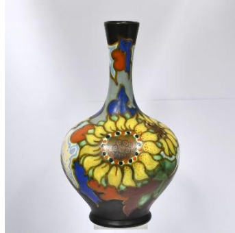
Decor Zonnebloem, ca 1930