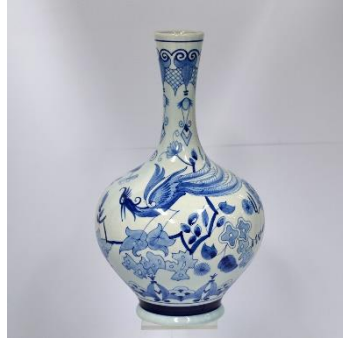
Decor De Pauw, 1938-1955