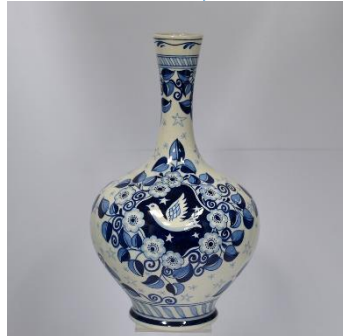
Decor Irene, 1939-1955