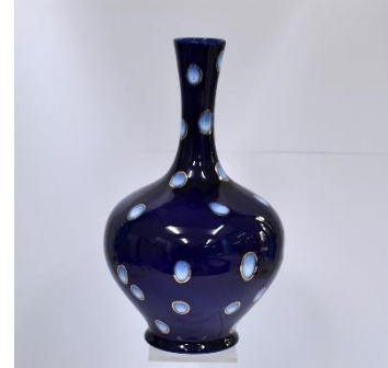
Decor Hermelijn, blauw, ca 1950