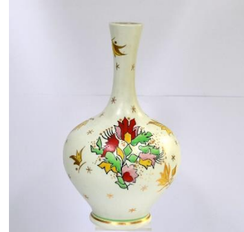
Decor Roda, ca 1954