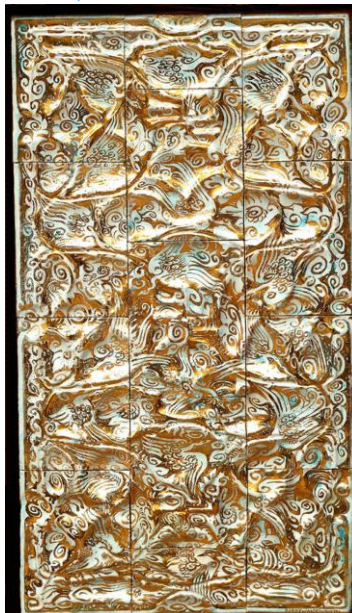
Goedewaagen, proef, reliëftableau voor ss Johan van Oldenbarnevelt in goud-nabrand,, 1930; coll. B.J. Baas