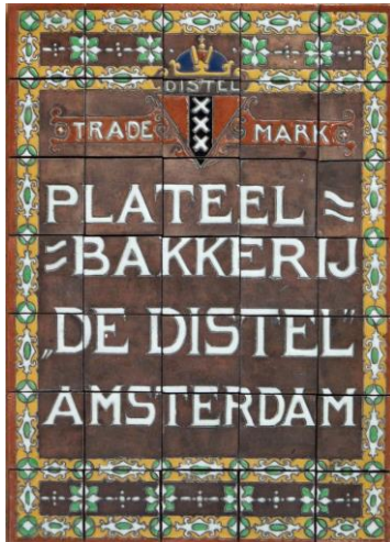
Distel, carduus-relametableau, ca 1912; coll. Meentwijk