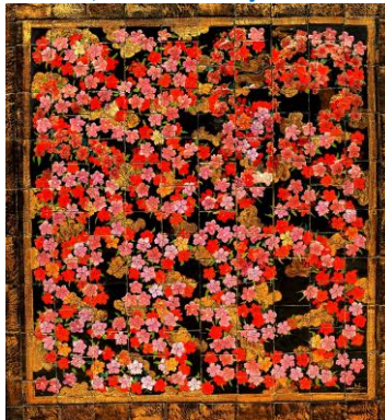
Goedewaagen, Akanhustableau Tjisidane, 1930, ontwerp C.A. Lion Cachet, coll. B.-J. Baas