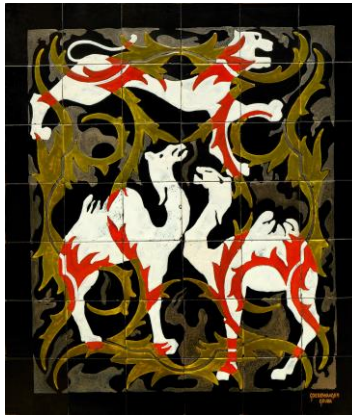
Goedewaagen, Akanhustableaus, ca 1928; coll. Meentwijk