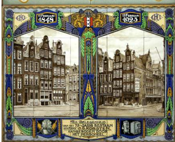
PBD, tegeltableaus, 1910-1923